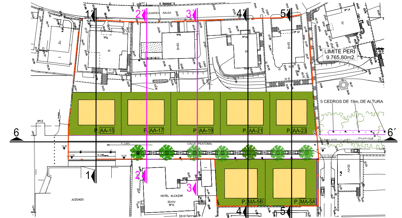
PLANTA DE PERFILES ( sin escala )