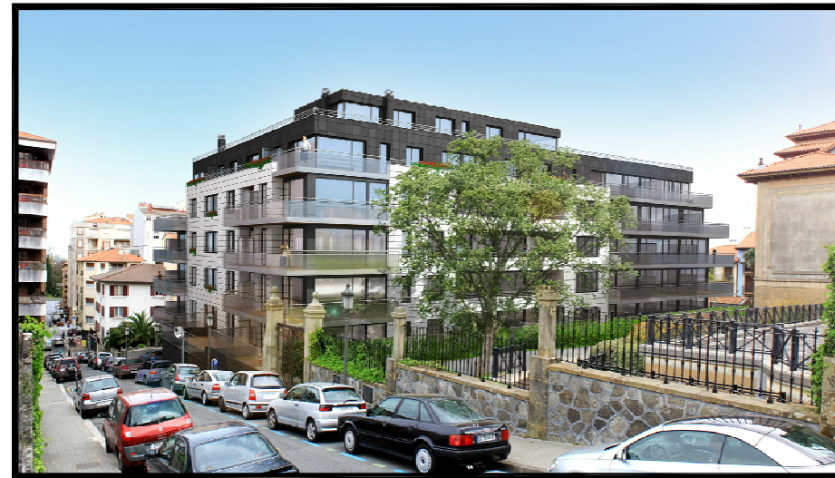
IMAGEN, IDEA DE VOLUMEN Nº 2