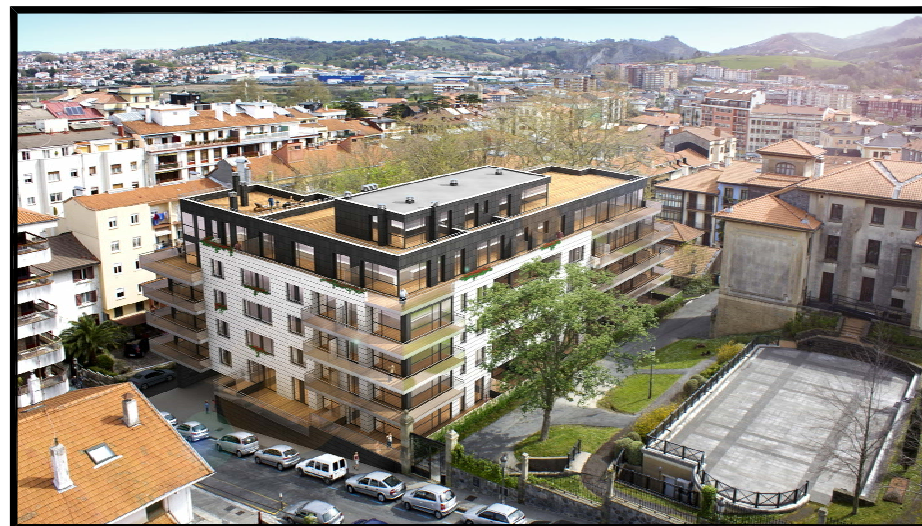
IMAGEN, IDEA DE VOLUMEN Nº 3