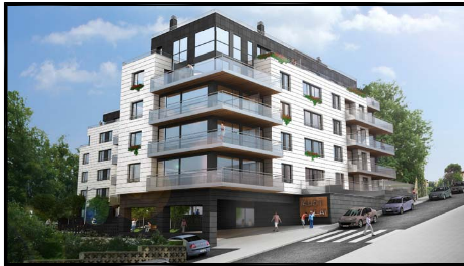
IMAGEN, IDEA DE VOLUMEN Nº 1