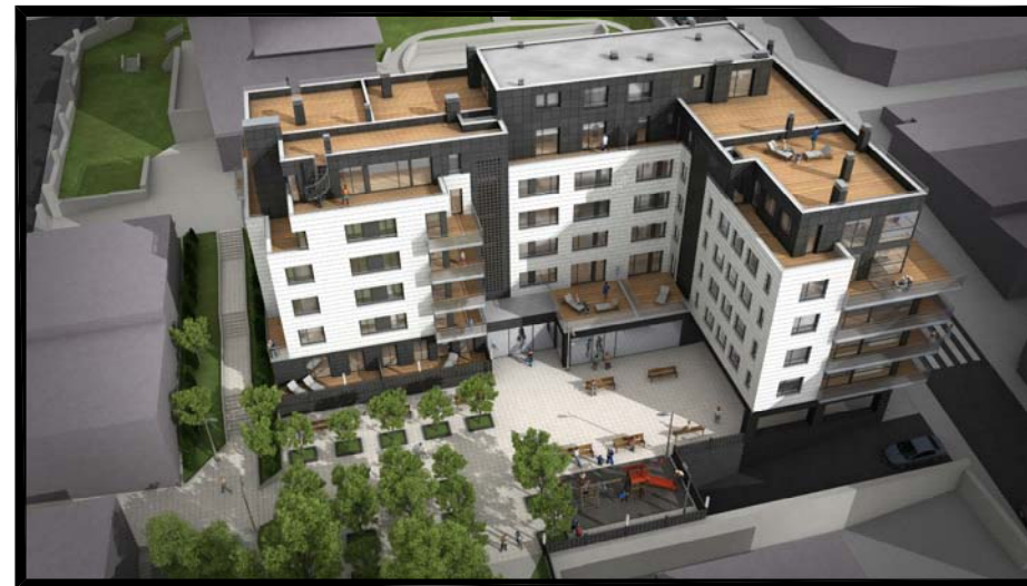
IMAGEN, IDEA DE VOLUMEN Nº 4