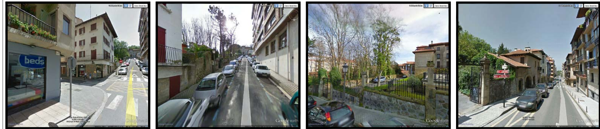
FOTOGRAFIAS DE ESTADO ACTUAL

SUELO URBANO CONSOLIDADO AMBITO DE ACTUACION 5.2.09 IKUST ALAIA: 2.532,65 M2. AMBITO ACTUACION DE DOTACION: 2.442,98 M2.