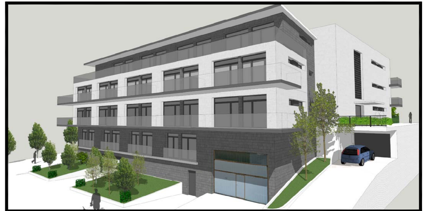
IMAGEN, IDEA DE VOLUMEN Nº 4