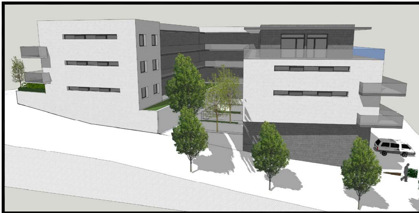
IMAGEN, IDEA DE VOLUMEN Nº 3