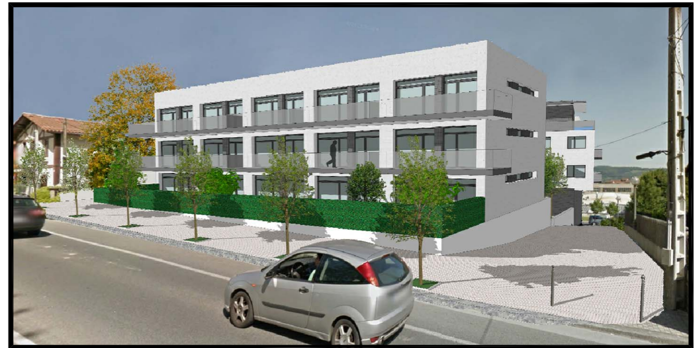
IMAGEN, IDEA DE VOLUMEN Nº 2