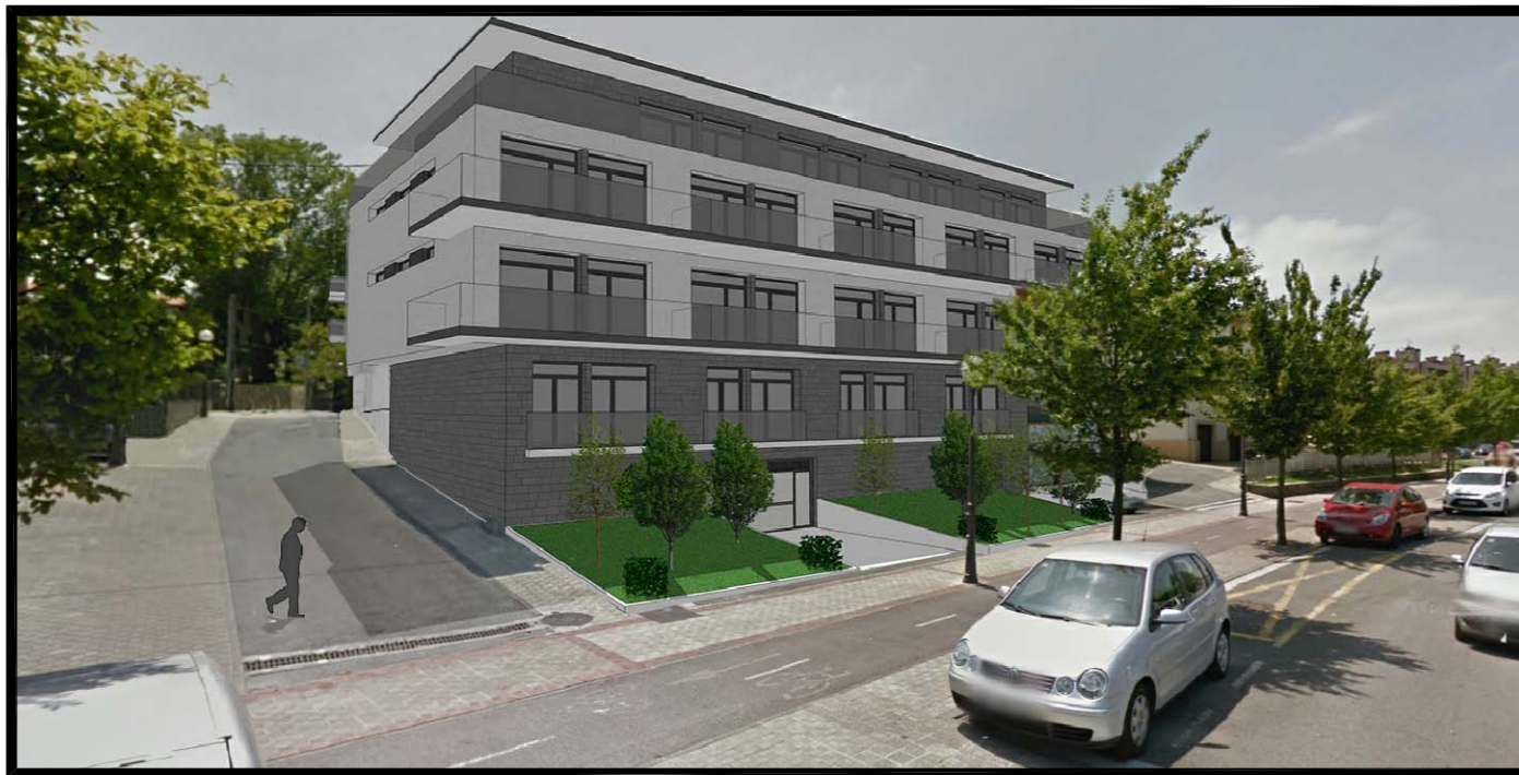
IMAGEN, IDEA DE VOLUMEN Nº 1