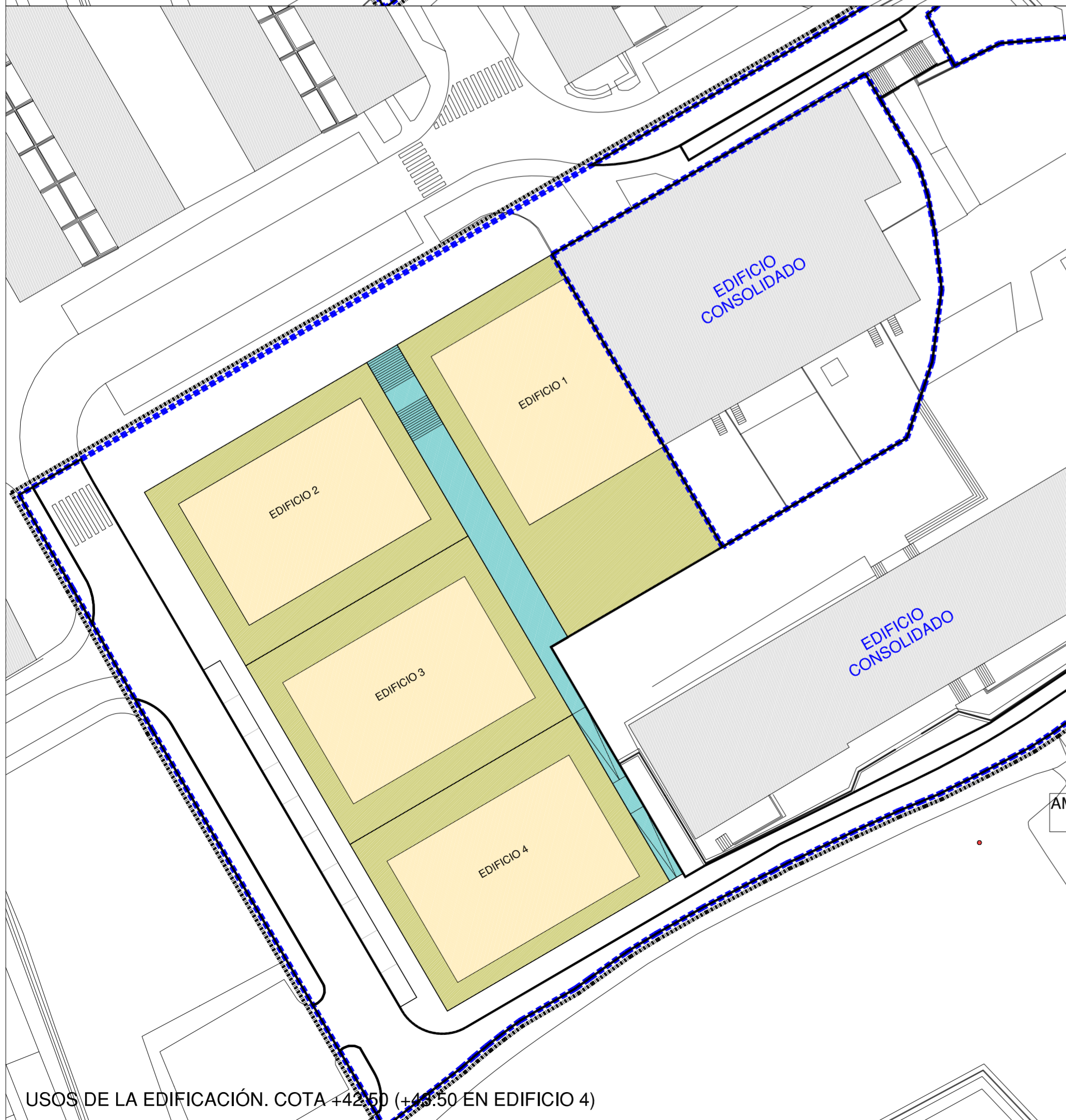
USOS DE LA EDIFICACIÓN. COTA +42.50 (+43.50 EN EDIFICIO 4)