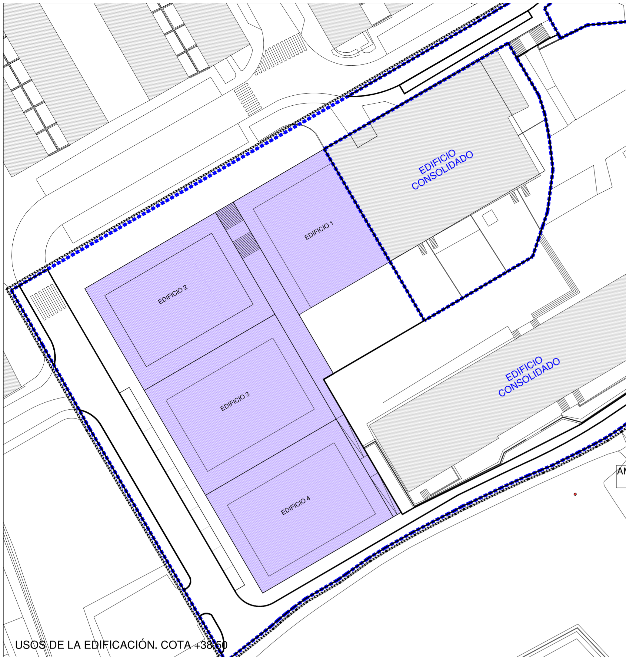
USOS DE LA EDIFICACIÓN. COTA +38.50