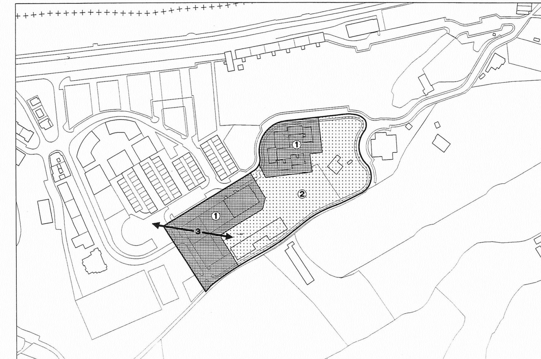
PLAN GENERAL DE ORDENACION URBANA DE IRUN