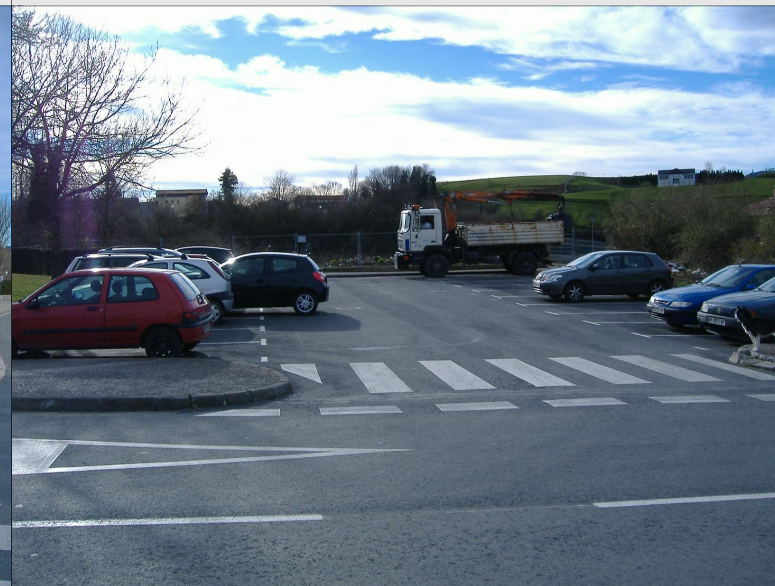
6. APARCAMIENTO EN CALLE BIENABE ARTIA