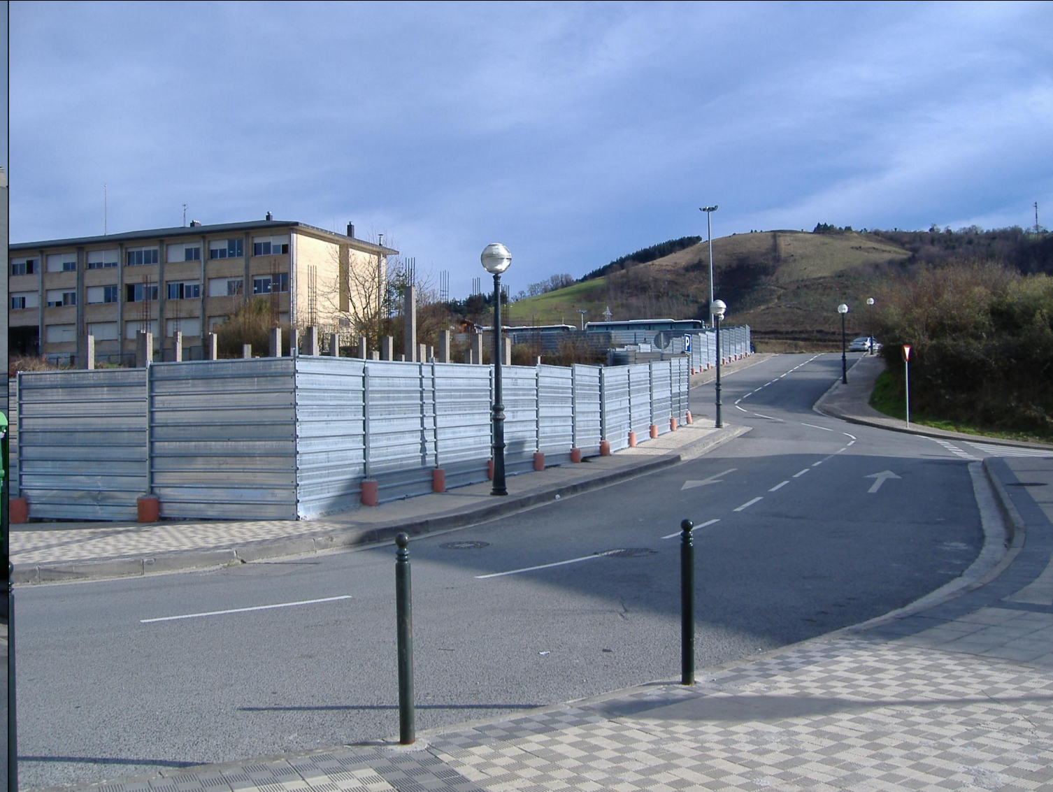
2. VISTA DE LA CALLE BIENABE ARTIA, HACIA EL SUR