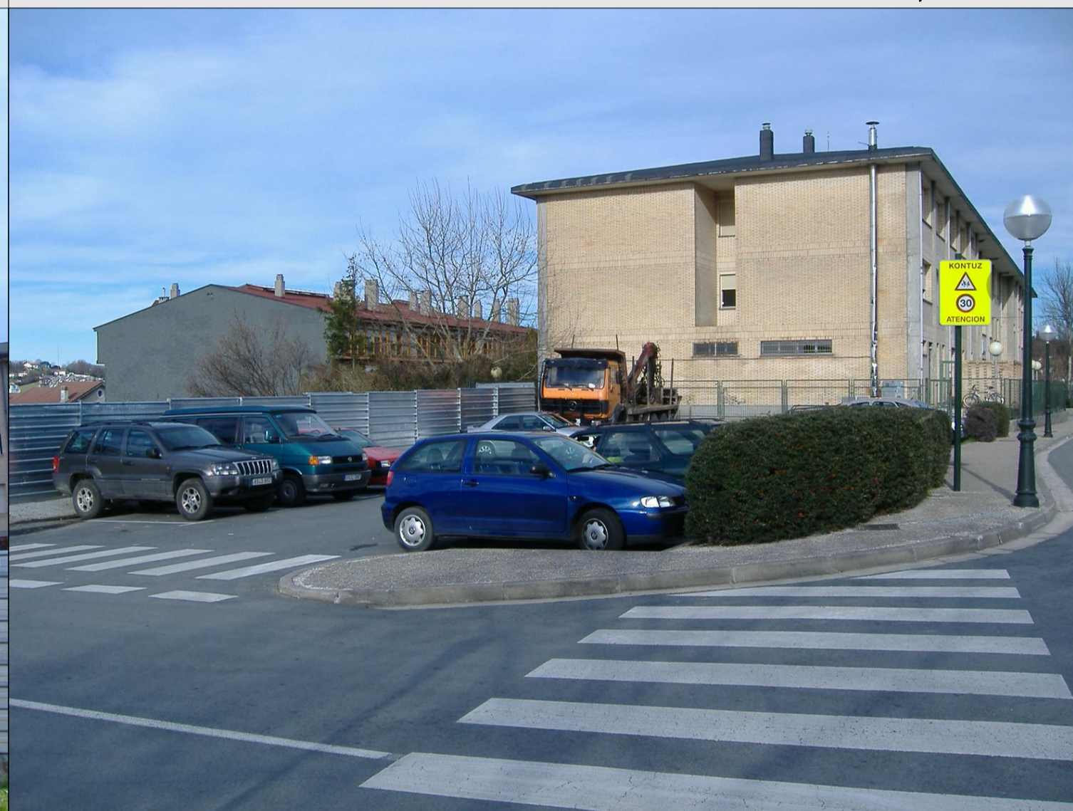
5. EDIFICIO ESCOLAR Y APARCAMIENTO