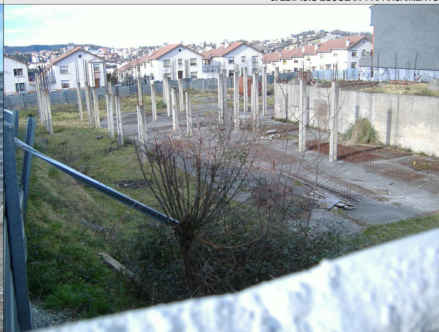
8. VISTA DEL ESTADO ACTUAL DEL SOLAR