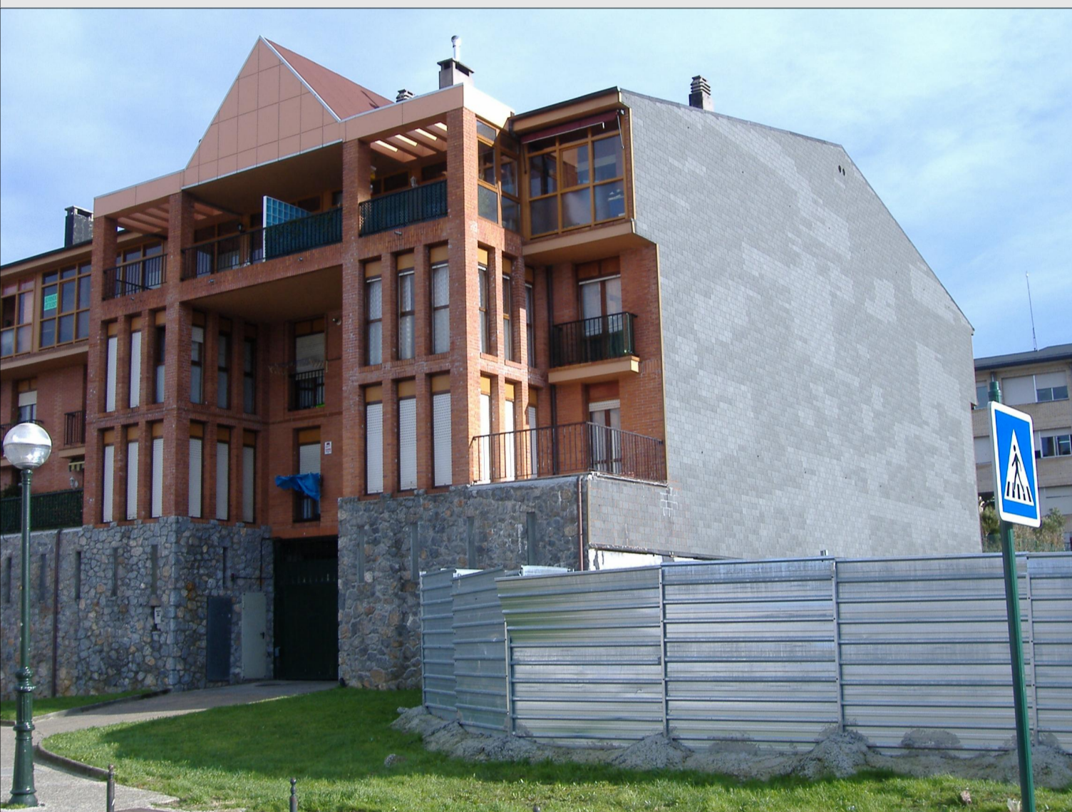
4. EDIFICIO EXISTENTE EN CALLE IPARRAGIRRE