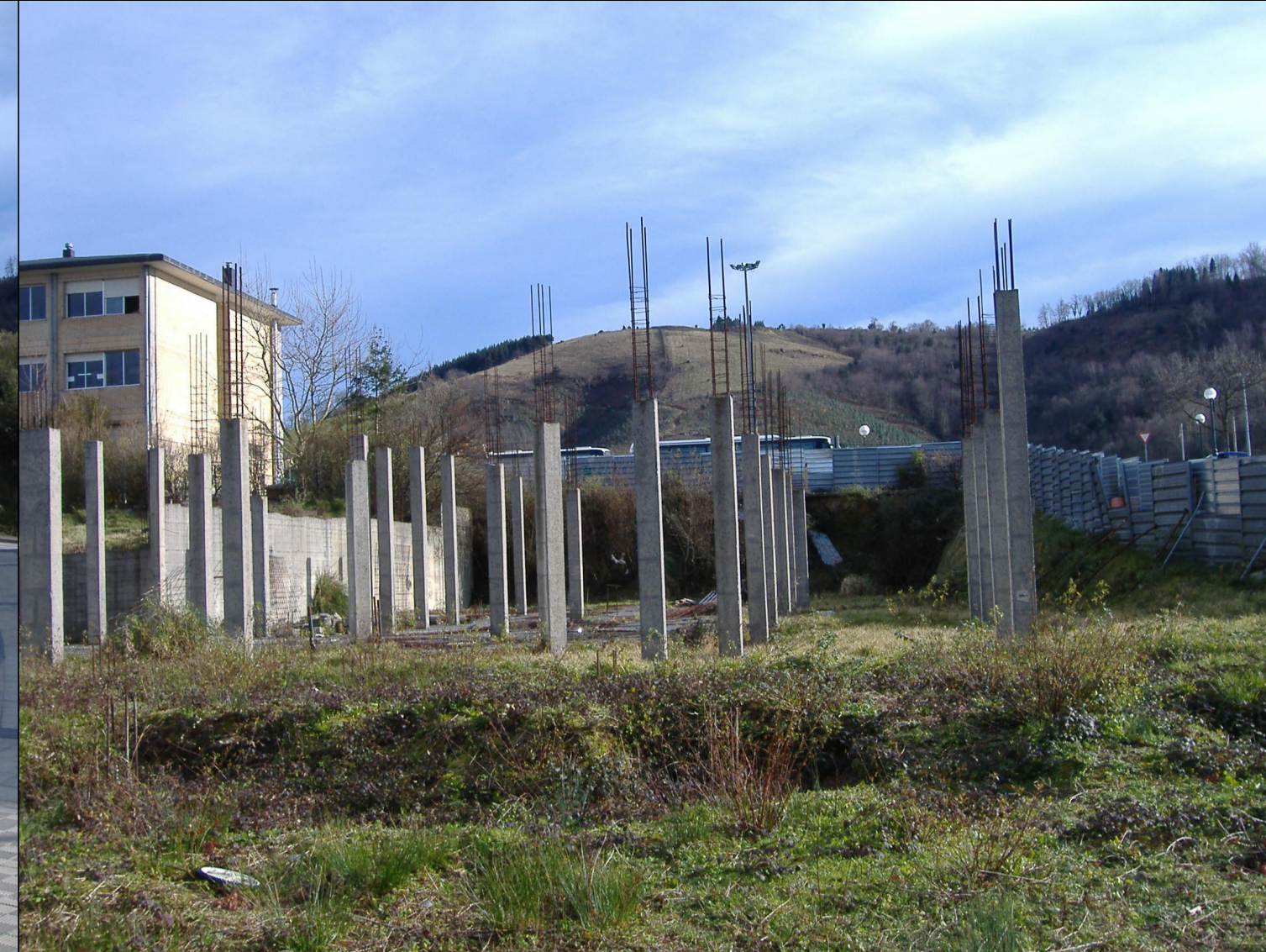
3. VISTA DEL ESTADO ACTUAL DEL SOLAR