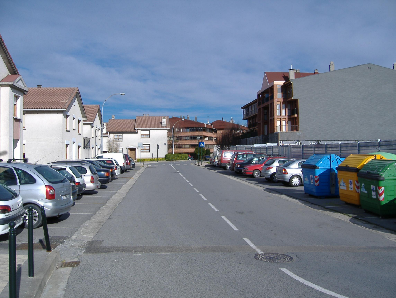
1. VISTA DE LA CALLE IPARRAGIRRE Y EDIFICIO EXISTENTE