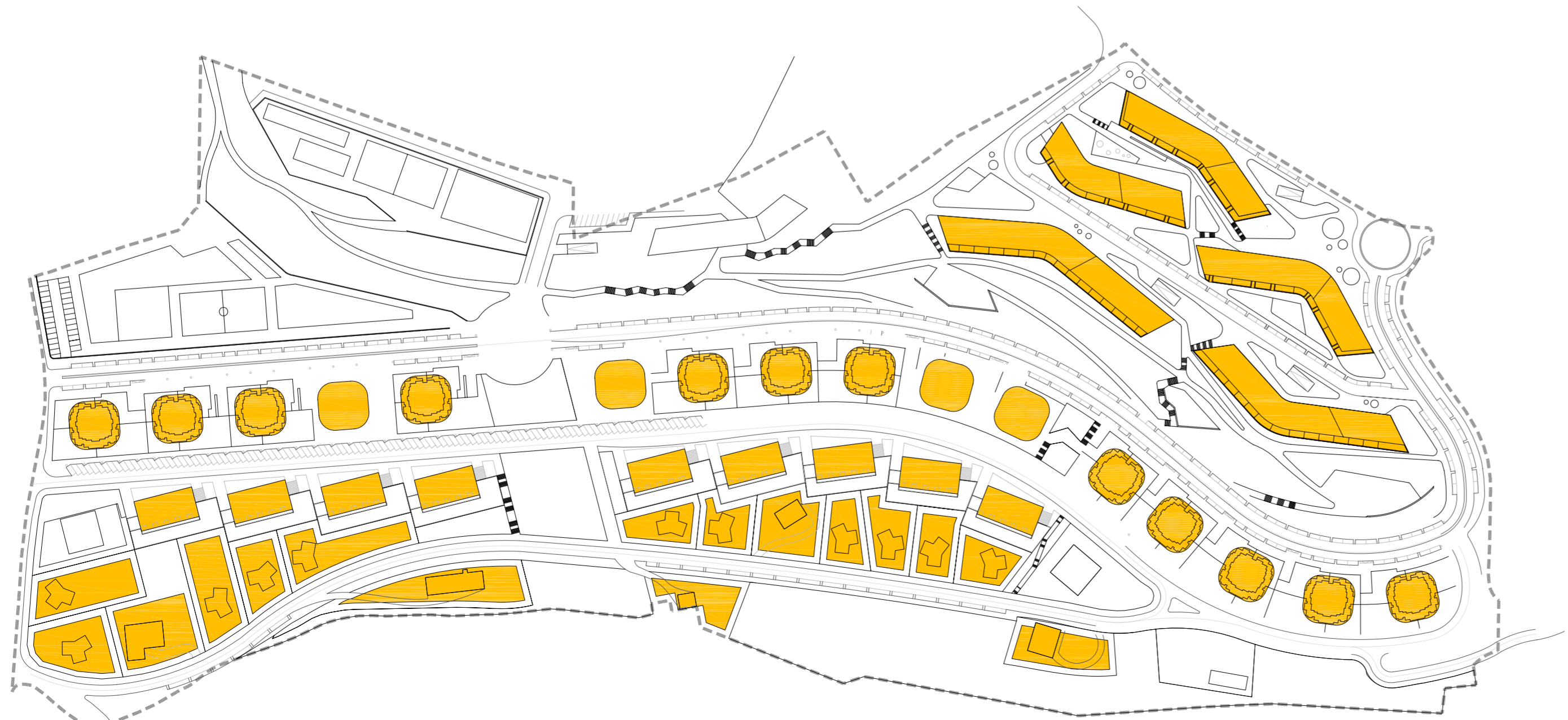
ocupación y usos en plantas tipo s/r