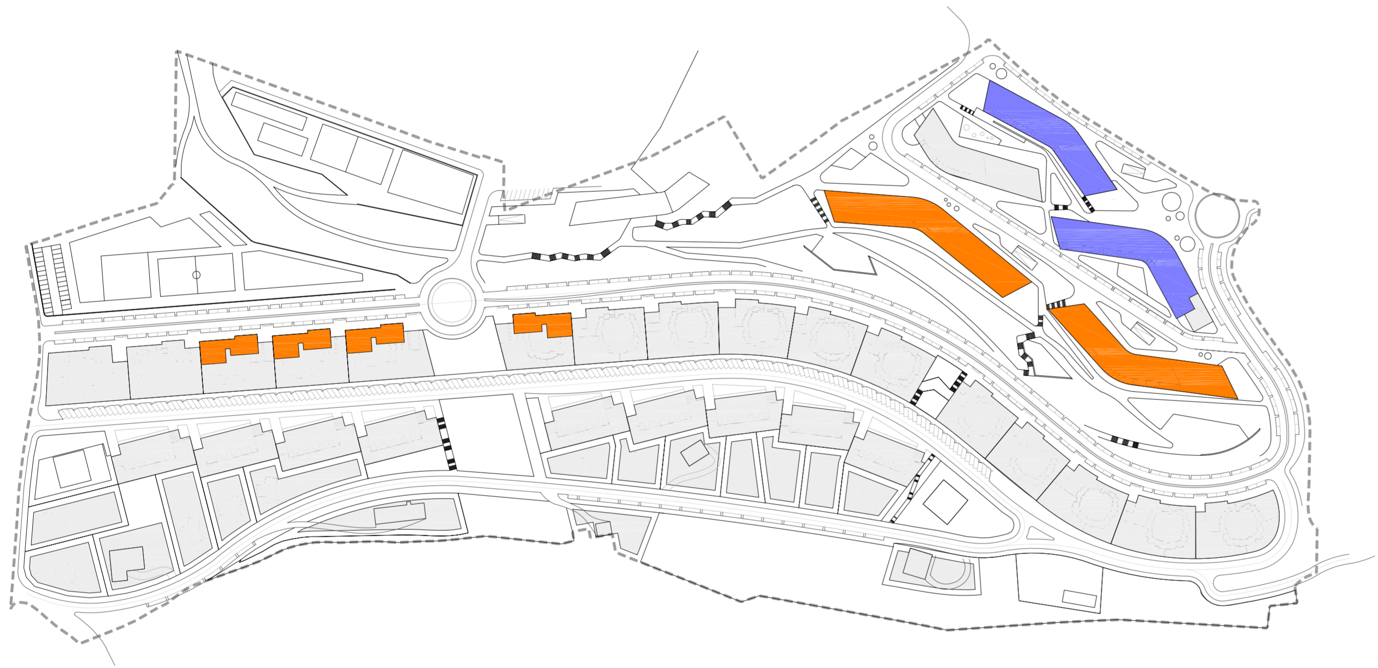
ocupación y usos en semisótano b/r