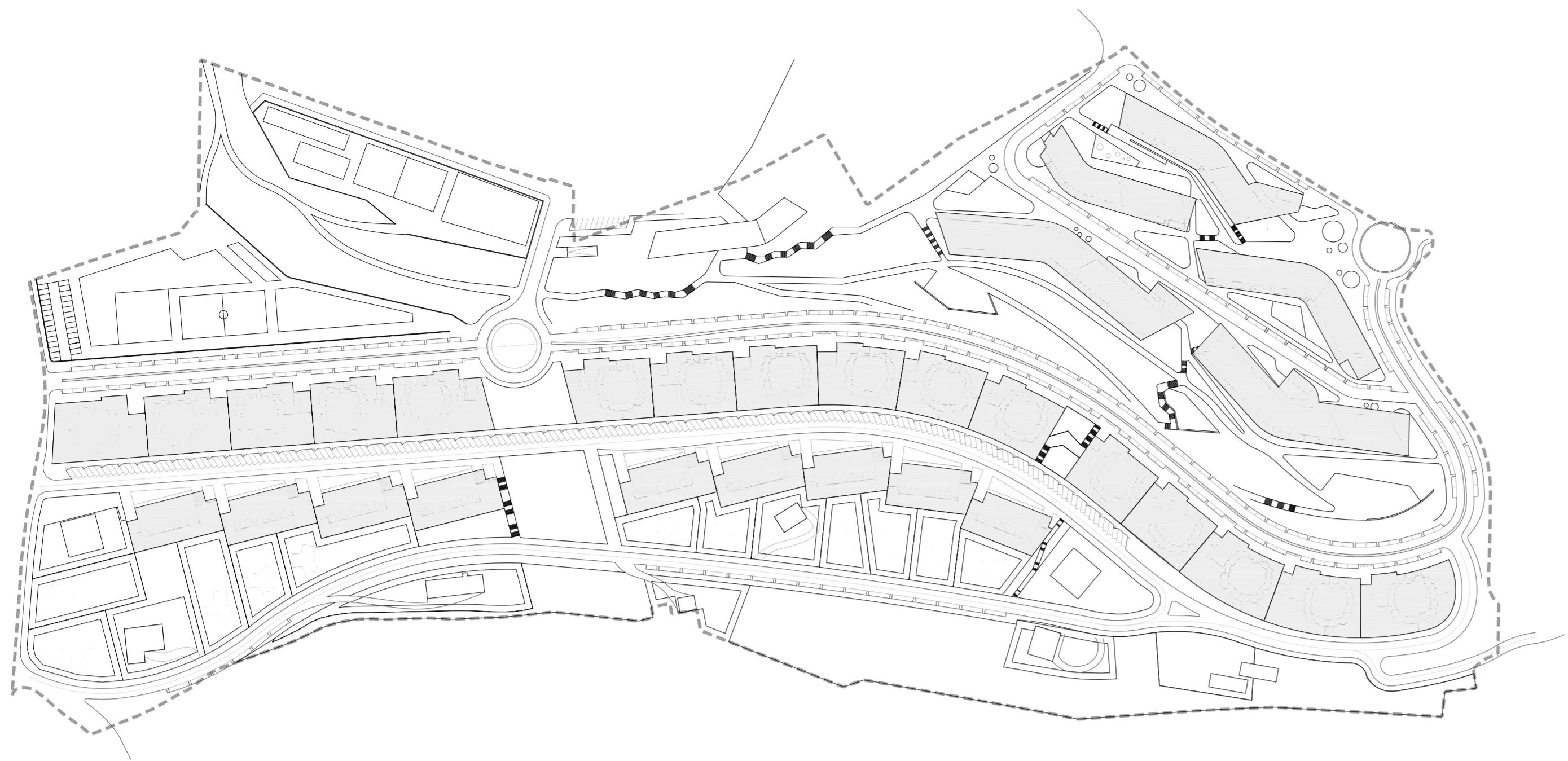
ocupación y usos en sótano b/r