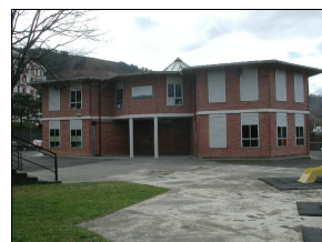
E4 PARVULARIO DE VENTAS