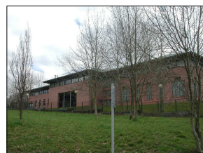
E1 EDIFICIO PRINCIPAL