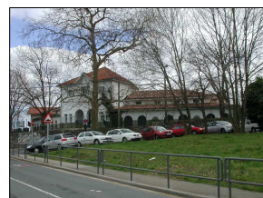
E3 EDIFICIO DE "LA REPÚBLICA"