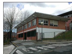
E2 EDIFICIO COMEDOR